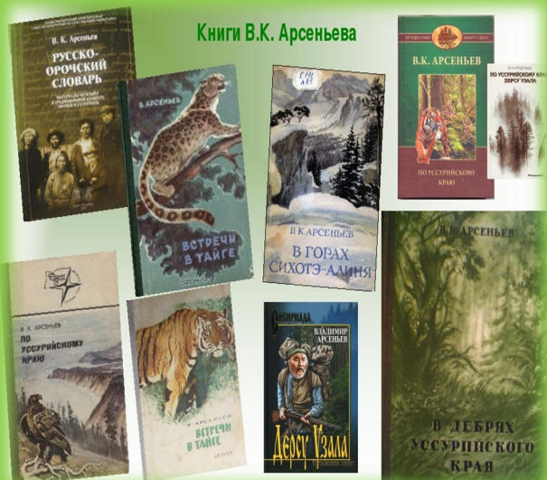
Книги В.К. Арсеньева

Тигр— священное животное, божество коренных народов Дальнего Востока